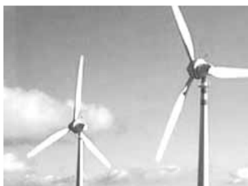
Eolico Numerosi impianti in Alta Irpinia