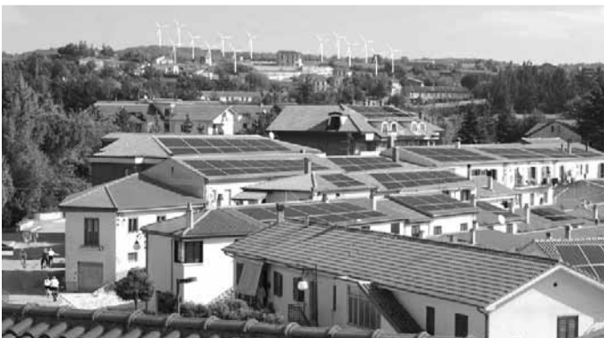
Il futuro Come sarebbe Sant'Angelo dei Lombardi con i pannelli solari

Si parte dall'Alta Irpinia. L'ente forum attraverso la pubblicazione dell'opuscolo e dei dati concernenti l'inquinamento del territorio, lancia un monito alle amministrazioni di tutta la provincia: adottiamo tecniche di risparmio energetico, per la salvaguardia dell'ambiente e per una corretta analisi dei costi e benefici. Sant'Angelo è situato a circa 870 metri sul livello del mare ed è circondato su tutto il perimetro da valli in cui scorrono