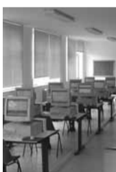
Internet Sono poche le aziende che si sono dotate di un sito web. In pochi usano internet e nuove tecnologie per le attività di marketing

costituito da 21 domande incentrate sulle caratteristiche delle imprese, l'organizzazione e la gestione dell'attività di comunicazione e l'efficacia percepita delle diverse attività svolte e sugli obiettivi di comunicazione perseguiti. In riferimento alla gestione delle attività di comunicazione, solo 3 aziende su 16 (quelle che hanno risposto correttamente ed oggetto dello studio) hanno dichiarato di avere un'unità organizzativa espressamente dedicata alla gestione della comunicazione aziendale; in tutti e tre i casi, tali uffici impiegano due persone, che si occupano anche delle attività di marketing. Un risultato interessante riguarda il budget di comunicazione investito: oltre