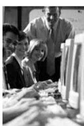
Consulenti Circa un terzo delle aziende contattate si avvale di professionisti esterni. Frequente la collaborazione con tipografie attrezzate

Organizzazione e budget Il questionario somministrato è